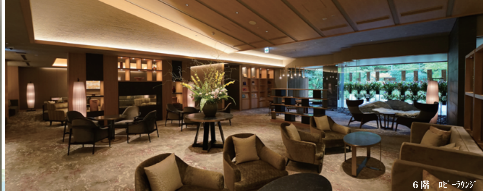
6階 ロビーラウンジ