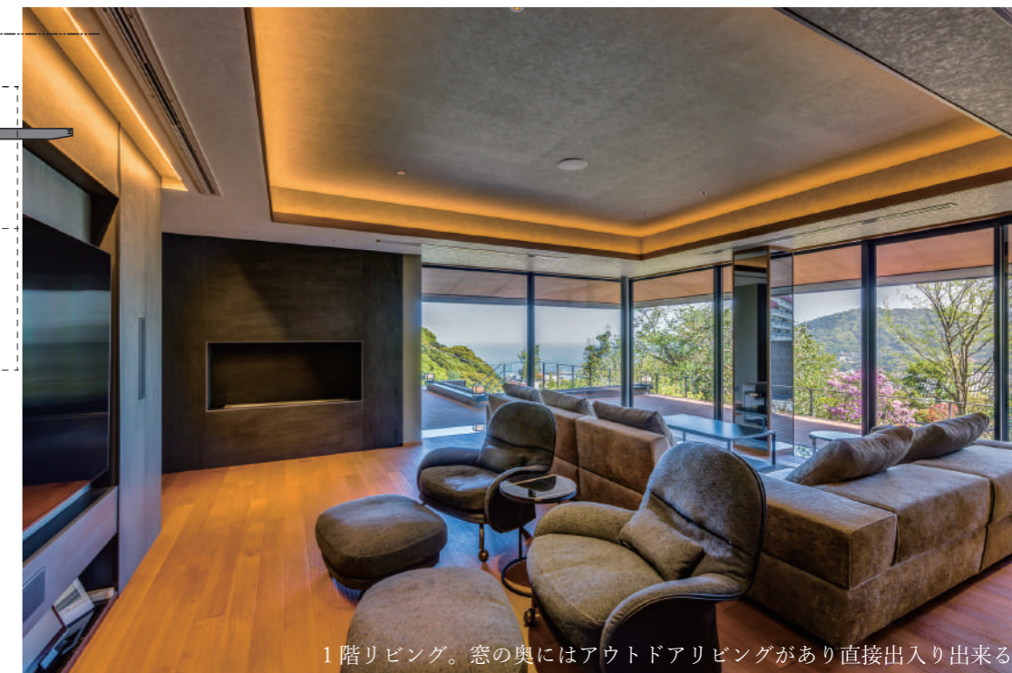
1階リビング。窓の奥にはアウトドアリビングがあり直接出入り出来る。