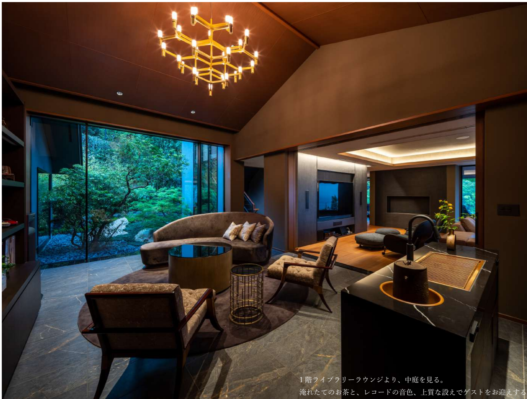
1階ライブラリーラウンジより、中庭を見る。 淹れたてのお茶と、レコードの音色、上質な設えでゲストをお迎えする。