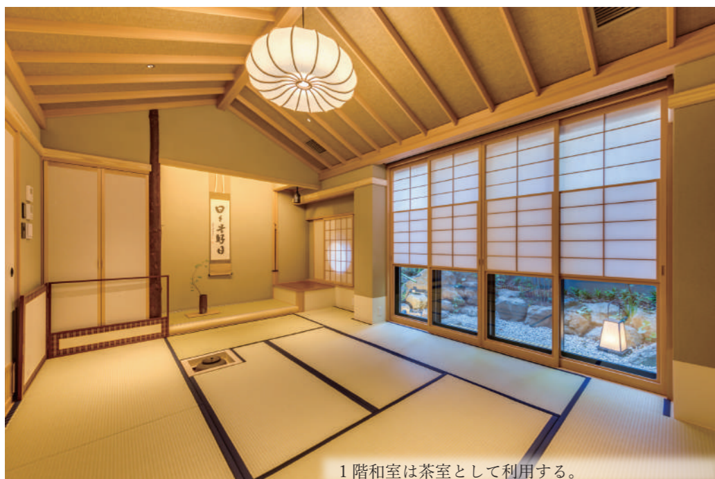
1階和室は茶室として利用する。