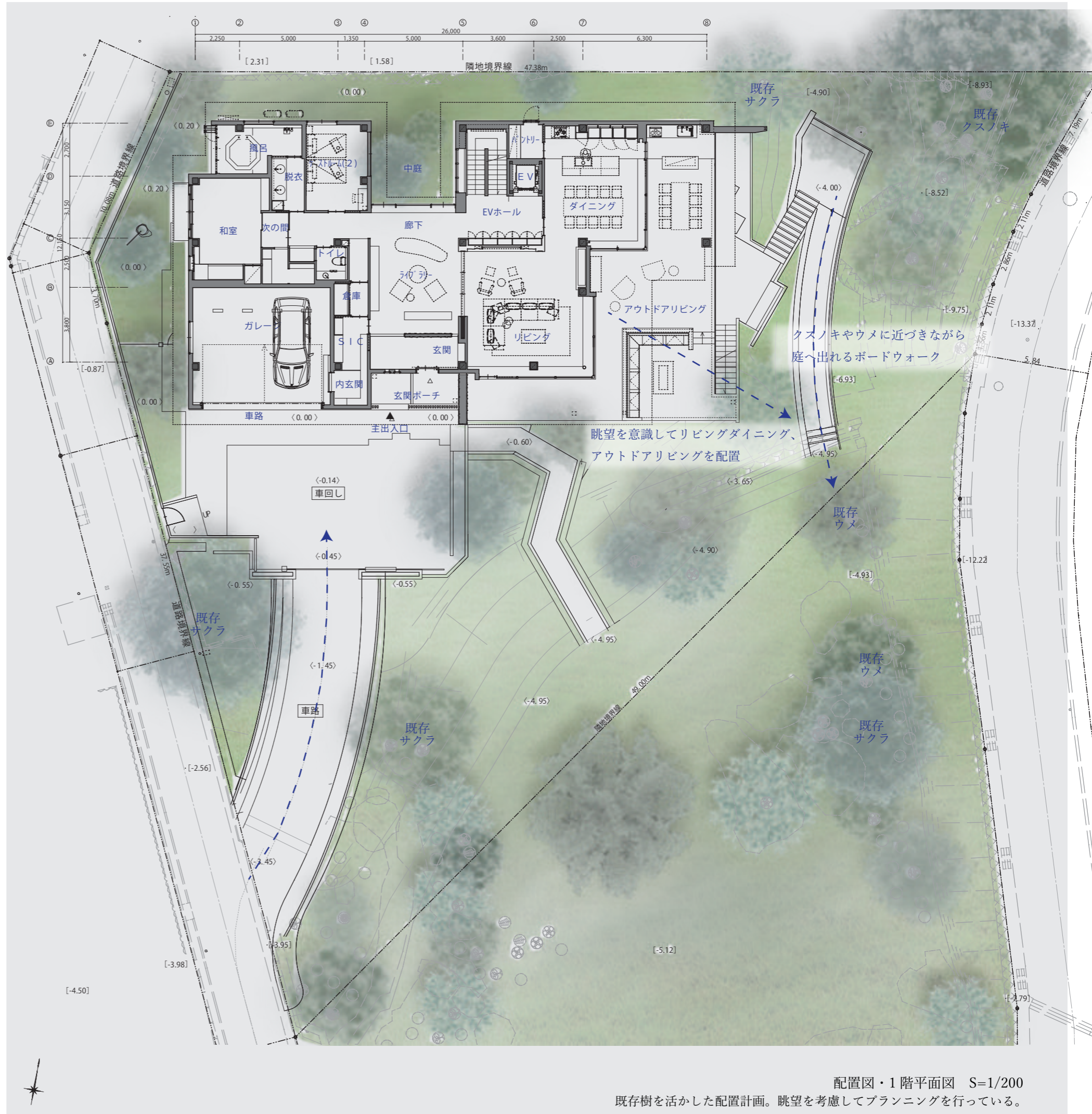
配置図・1階平面図 S=1/200 既存樹を活かした配置計画。眺望を考慮してプランニングを行っている。