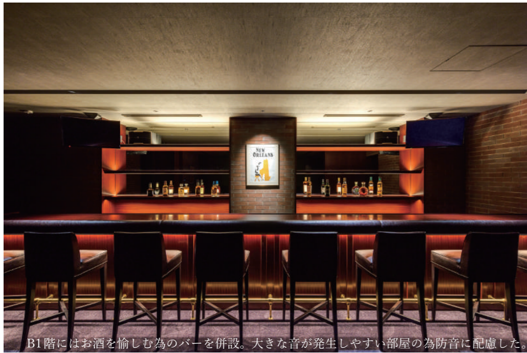
B1階にはお酒を愉しむ為のバーを併設。大きな音が発生しやすい部屋の為防音に配慮した。