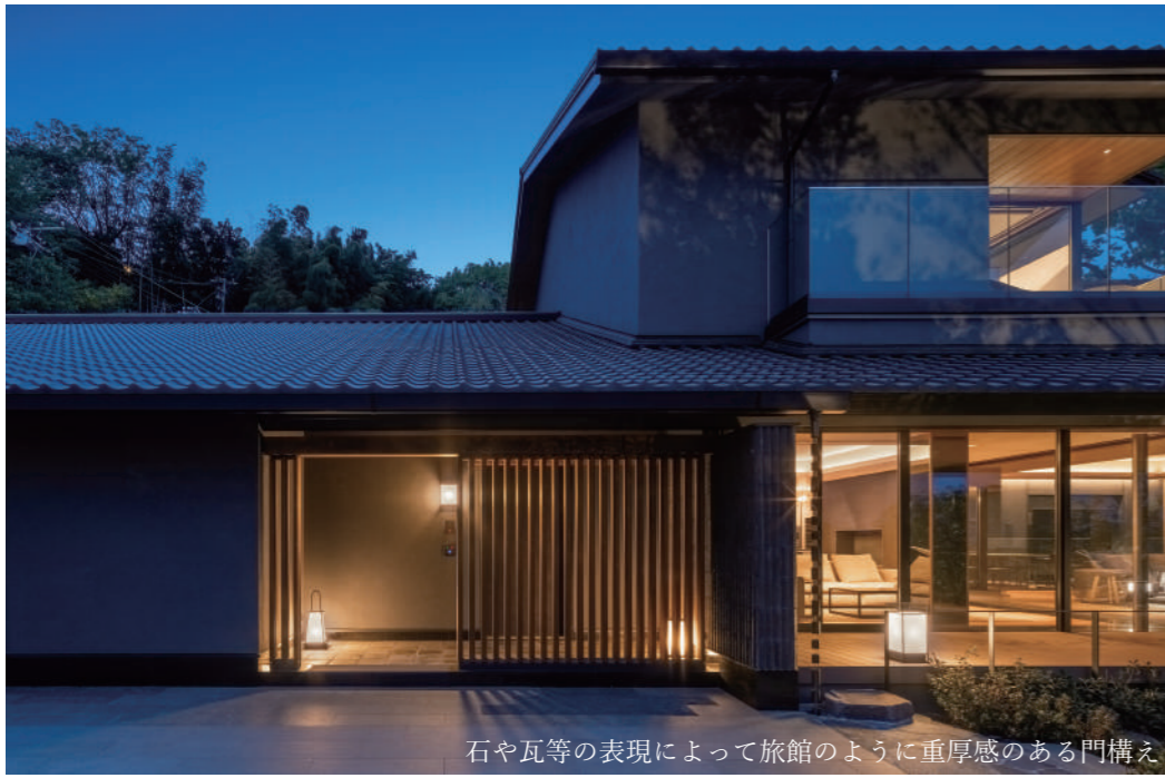
石や瓦等の表現によって旅館のように重厚感のある門構え