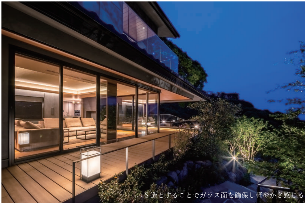
S造とすることでガラス面を確保し軽やかさを感じる