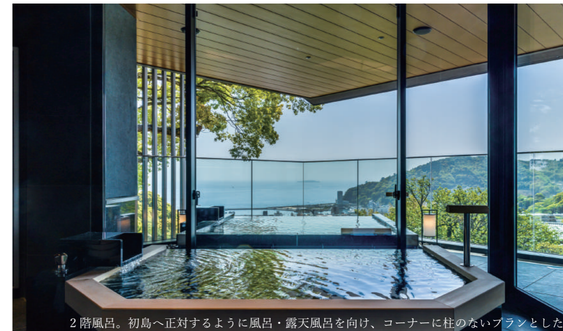
2階風呂。初島へ正対するように風呂・露天風呂を向け、コーナーに柱のないプランとした。