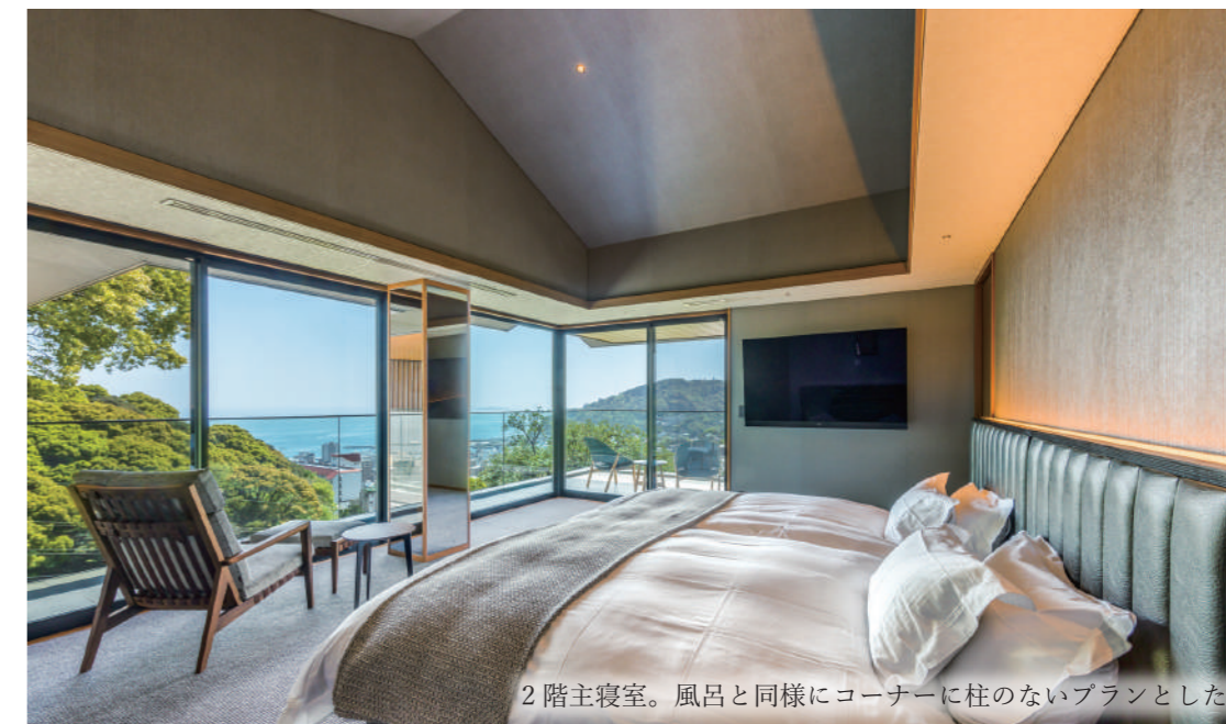
2階主寝室。風呂と同様にコーナーに柱のないプランとした。