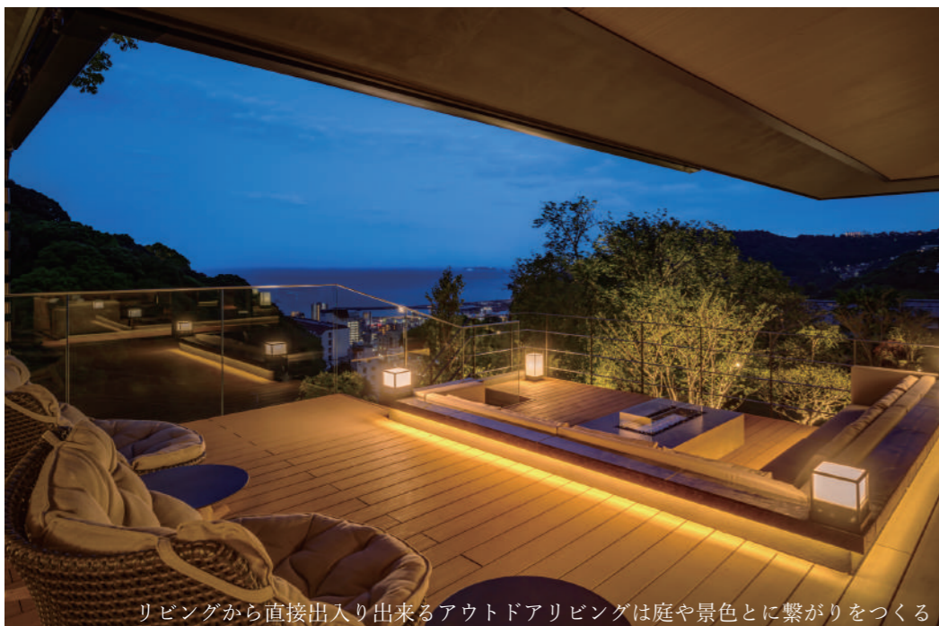
リビングから直接出入り出来るアウトドアリビングは庭や景色とに繋がりをつくる