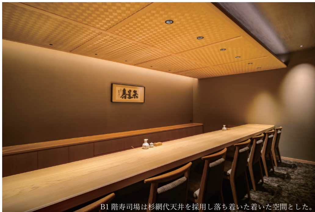
B1階寿司場は杉網代天井を採用し落ち着いた着いた空間とした。