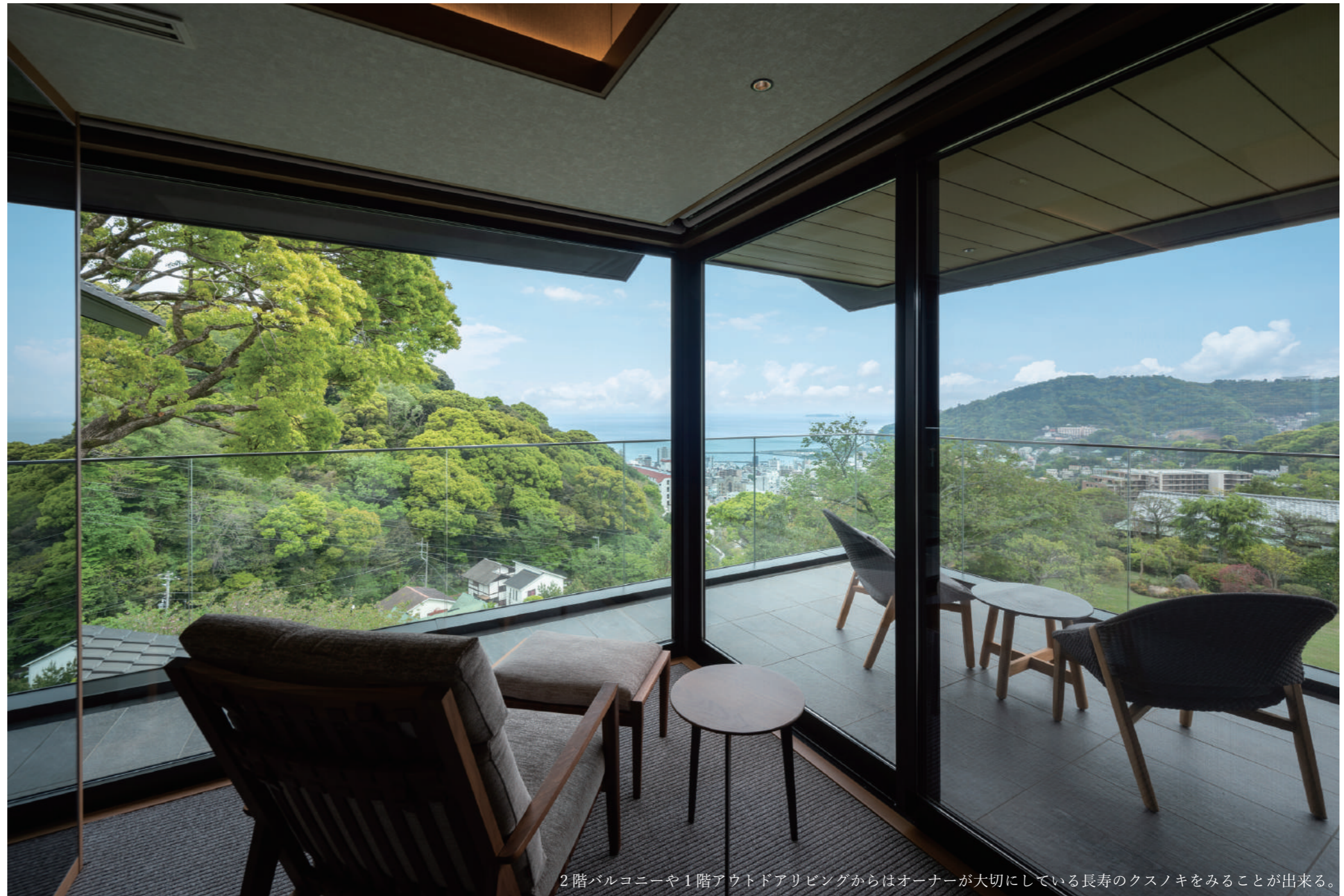
2階バルコニーや1階アウトドアリビングからはオーナーが大切にしている長寿のクスノキをみることが出来る。