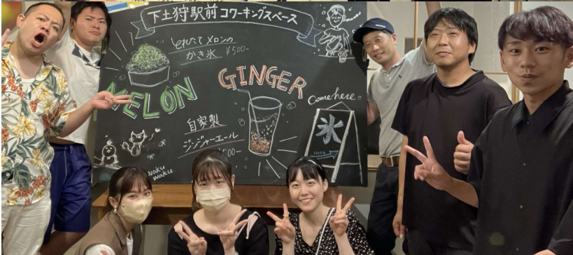
「下土狩駅前コワーキングスペース」(長泉町)を活用したイベント