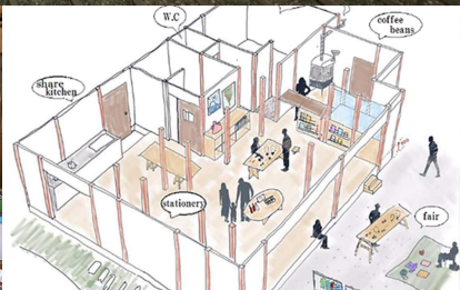
チャレンジシェアテナント「SUSONOTOWA」(裾野市)