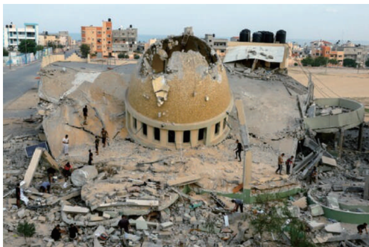
ハマスによる攻撃で破壊されたモスク