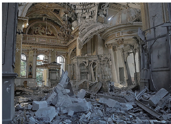
破壊されたウクライナ正教会の救世主顕栄大聖堂