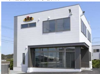
株式会社サイト 東遠営業所事務所