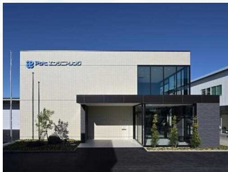
アサヒエンジニアリング 株式会社社屋