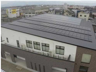
株式会社植松ビル