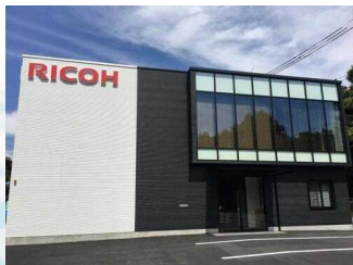
リコージャパン 株式会社掛川事業所