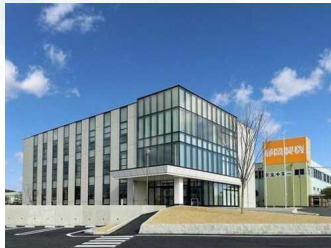
静岡製機株式会社本社屋